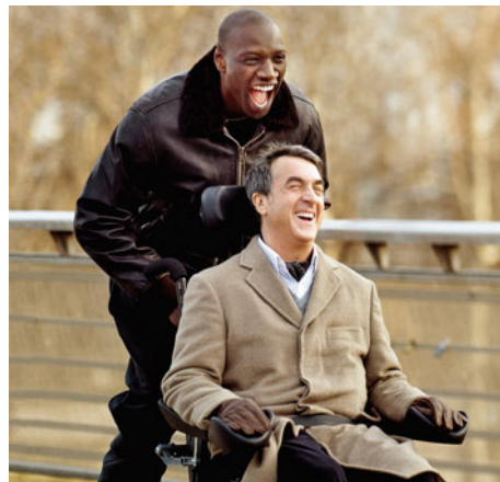
Szene aus „Ziemlich beste Freunde“, 2012* „Ich hielt das Leben für ein großes Spiel“